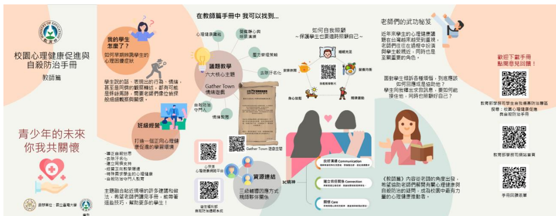
校園心理健康促進與自殺防治手冊教師篇