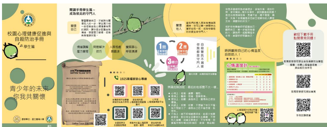
校園心理健康促進與自殺防治手冊學生篇