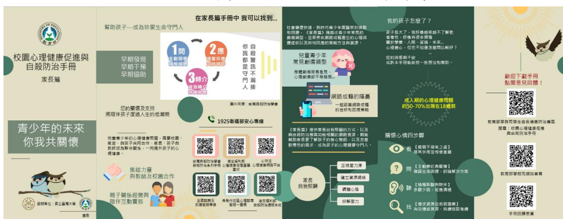
校園心理健康促進與自殺防治手冊家長篇